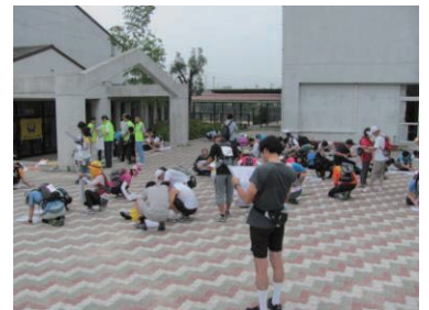
スタート前の作戦タイム(2012.6 フォトロゲイニング in 大阪いづみ)