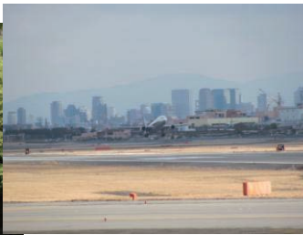
↑大阪(伊丹)空港 ←箕面の滝