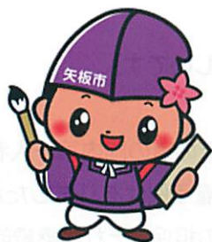
「矢板市キャラクターともなりくん (許可番号第 225 号)」