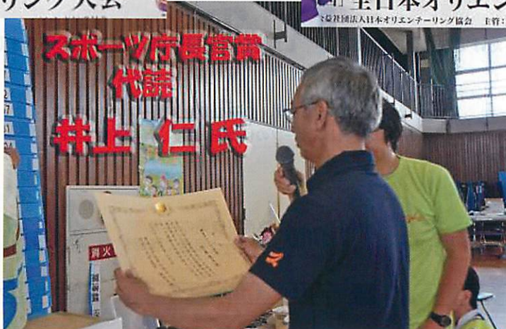
男女選手権者に スポーツ庁長官賞 が贈られる