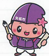
矢板市キャラクターともなりくん (許可番号225号)