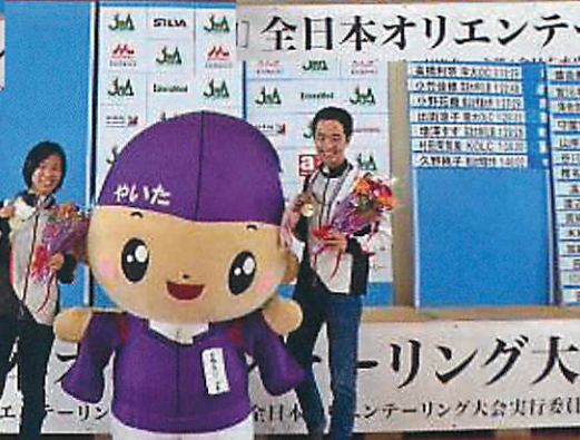
平成 28 年度 男女選手権者