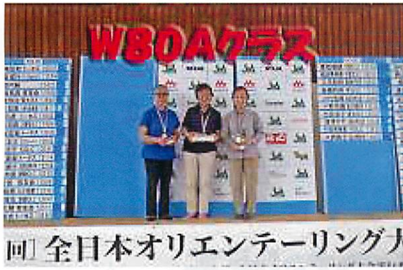
男女 最高齢 クラス